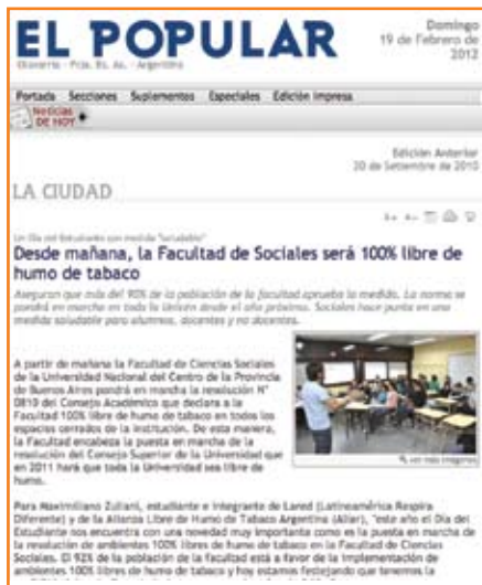
20/09/10 - Diario El Popular, Olavarría www.elpopular.com.ar

La medida tuvo gran impacto en los medios de comunicación locales, tanto gráficos, como radiales y televisivos, y este hecho colaboró en la difusión de la política y en su gran aceptación.