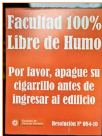
Cartel utilizado en las entradas de la la Facultad de Cs. Sociales de la UNICEN.

El 2 de julio de 2010, tras este gran esfuerzo y después de tres meses de trabajo, los alumnos del centro de estudiantes elevaron al Consejo Académico el pedido de declarar la facultad libre de humo y un modelo de resolución que contemplaba, además de esta medida, la prohibición de venta y publicidad de productos de tabaco dentro de la facultad. La resolución fue sometida a votación y aprobada por unanimidad. De este modo, se decidió que la Facultad de Ciencias Sociales de la Universidad Nacional del Centro sería 100% libre de humo a partir del 21 de septiembre de 2010 bajo resolución 084-10.