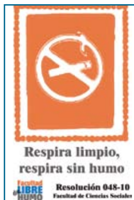
Cartel utilizado en la Facultad de Cs. Sociales de la UNICEN