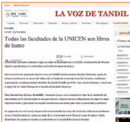
03/01/11 - Diario La Voz de Tandil www.lavozdetandil.com.ar