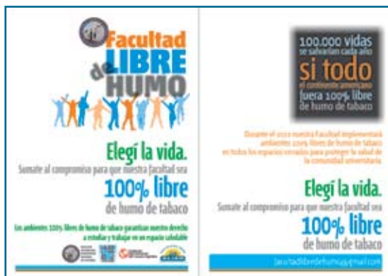
Volante entregado en la Facultad de Medicina de la Universidad Nacional de Tucumán

05. Colocar carteles que indiquen la prohibición de fumar Los carteles y señales deben ser claros y simples y deben ubicarse especialmente en lugares estratégicos, como entradas principales, pasillos de circulación y bares. También se deben retirar los ceniceros y todo objeto que invite a fumar.